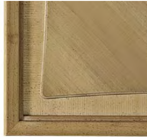
Cod. P Paglia