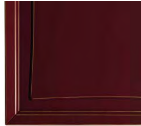
Cod. R Rosso bordeaux cerato