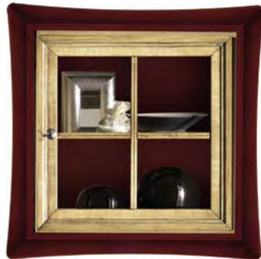
Proposta Proposal 30 Anta Door Paglia Cornice Frame Rosso bordeaux cerato Scocca Structure Paglia Schienale Back Rosso bordeaux cerato