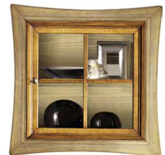
Proposta Proposal 120 Anta Door Noce Cornice Frame Paglia Scocca Structure Noce Schienale Back Paglia