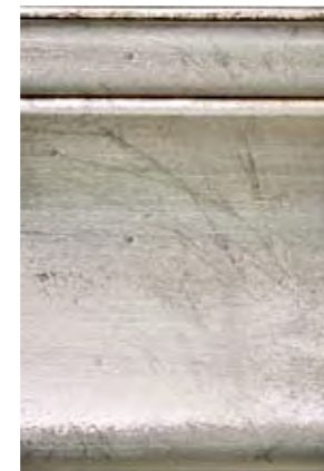
Cod. ARG Argento