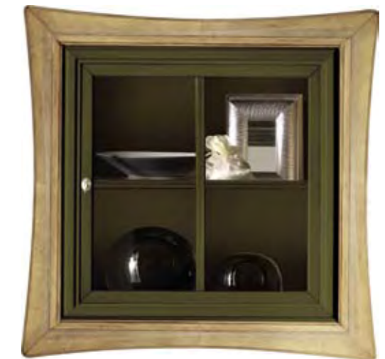
Proposta Proposal 80 Anta Door Verde cerato Cornice Frame Paglia Scocca Structure Verde cerato Schienale Back Verde cerato