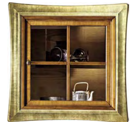
Proposta Proposal 100 Anta Door Noce Cornice Frame Oro Scocca Structure Noce Schienale Back Noce