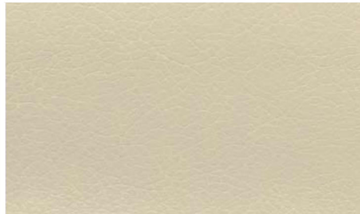
Cod. OP Ecopelle beige opaco Opaque beige eco leather