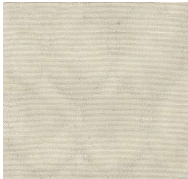
Cod. FB Tessuto Fabric