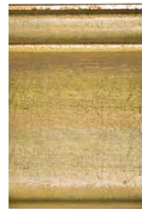
Cod. ORO Oro