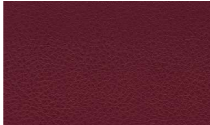
Cod. OR Ecopelle rosso bordeaux opaco Opaque dark red eco leather