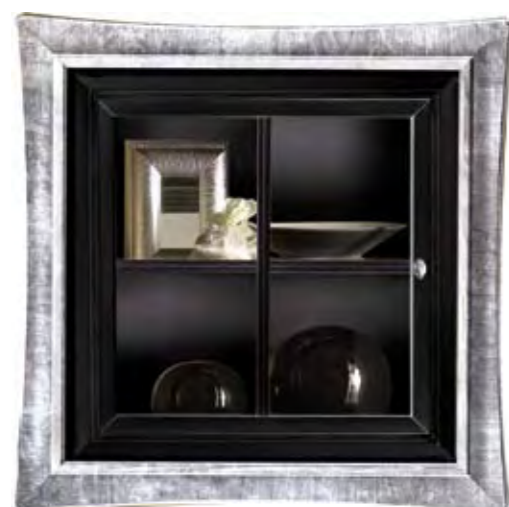
Proposta Proposal 50 Anta Door Nero cerato Cornice Frame Argento Scocca Structure Nero cerato Schienale Back Nero cerato