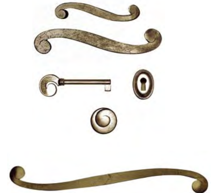
Cod. 6 Maniglie bronzate Bronze coated handles