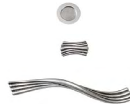
Cod. 7 Maniglie argentate Silver coated handles