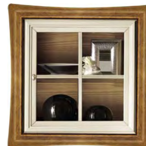
Proposta Proposal 110 Anta Door Bianco cerato Cornice Frame Noce Scocca Structure Bianco cerato Schienale Back Noce