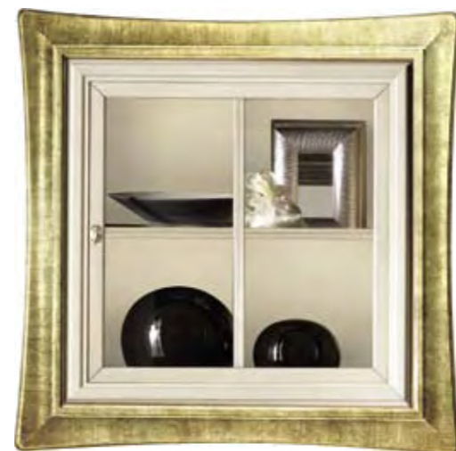
Proposta Proposal 40 Anta Door Bianco cerato Cornice Frame Oro Scocca Structure Bianco cerato Schienale Back Bianco cerato