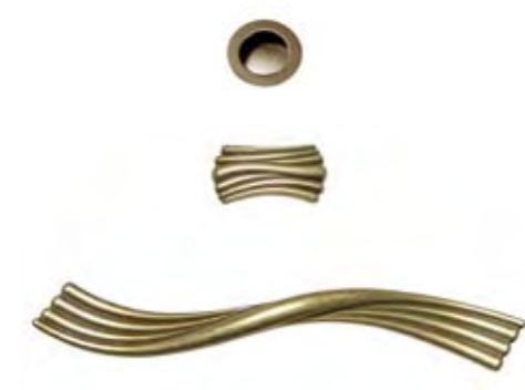
Cod. 7 Maniglie bronzate Bronze coated handles