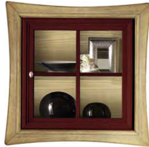
Proposta Proposal 20 Anta Door Rosso bordeaux cerato Cornice Frame Paglia Scocca Structure Rosso bordeaux cerato Schienale Back Paglia