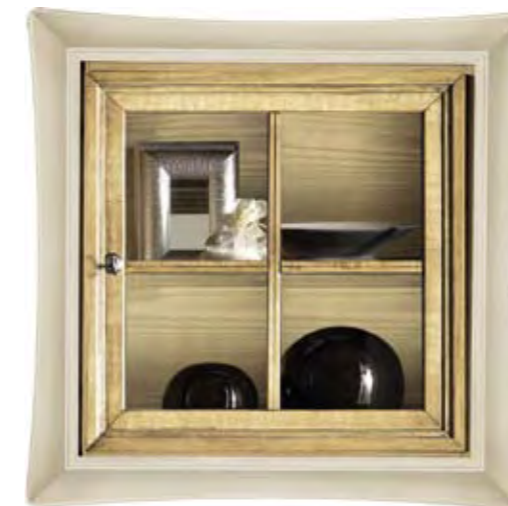
Proposta Proposal 70 Anta Door Paglia Cornice Frame Bianco cerato Scocca Structure Paglia Schienale Back Paglia