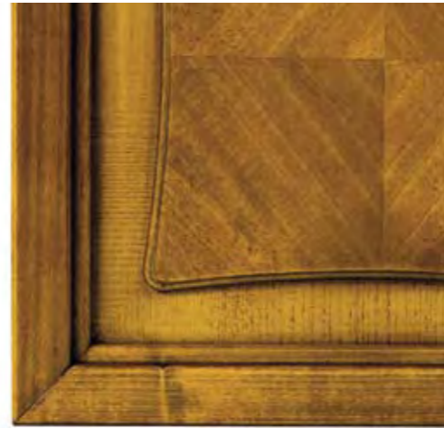
Cod. N Noce