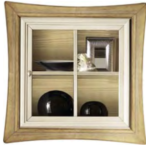
Proposta Proposal 10 Anta Door Bianco cerato Cornice Frame Paglia Scocca Structure Bianco cerato Schienale Back Paglia