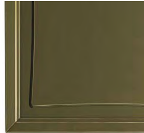
Cod. V Verde cerato