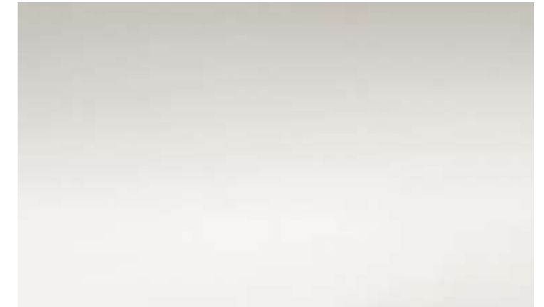
Cod. LB Ecopelle bianco lucido Glossy white eco leather