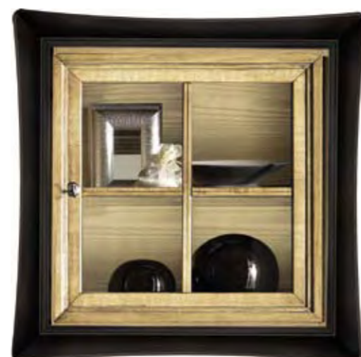
Proposta Proposal 60 Anta Door Paglia Cornice Frame Nero cerato Scocca Structure Paglia Schienale Back Paglia