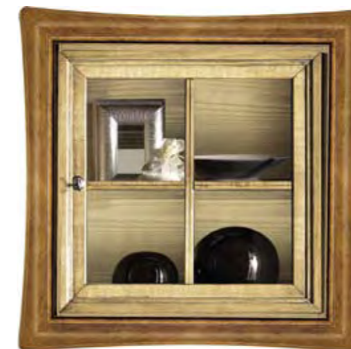
Proposta Proposal 90 Anta Door Paglia Cornice Frame Noce Scocca Structure Paglia Schienale Back Paglia