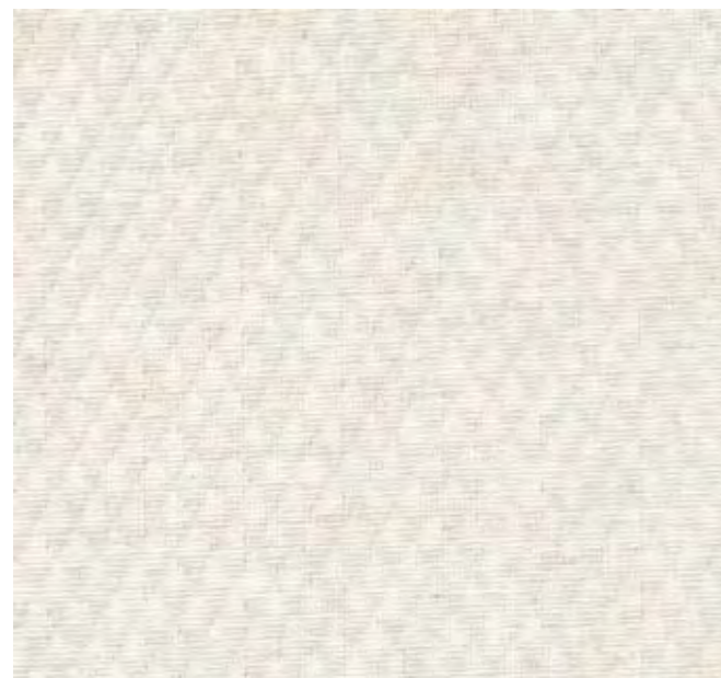
Cod. B4 Tessuto Fabric