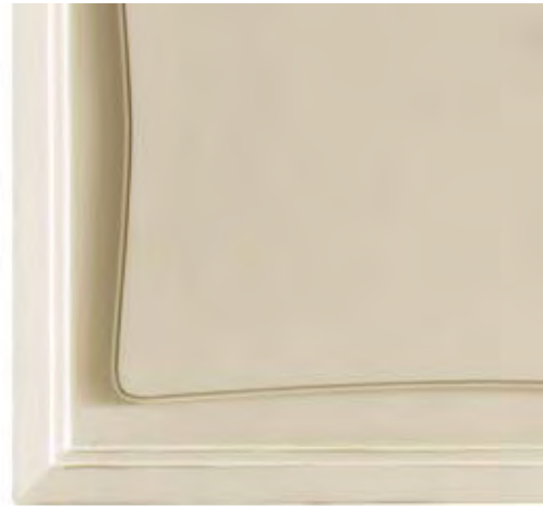
Cod. B Bianco cerato