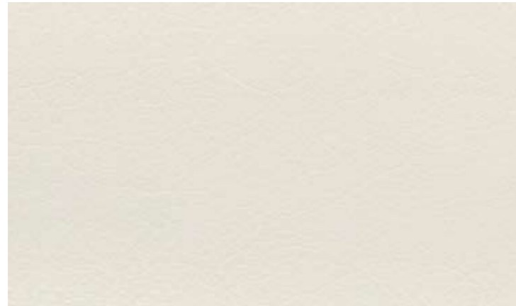
Cod. OB Ecopelle bianco opaco Opaque white eco leather