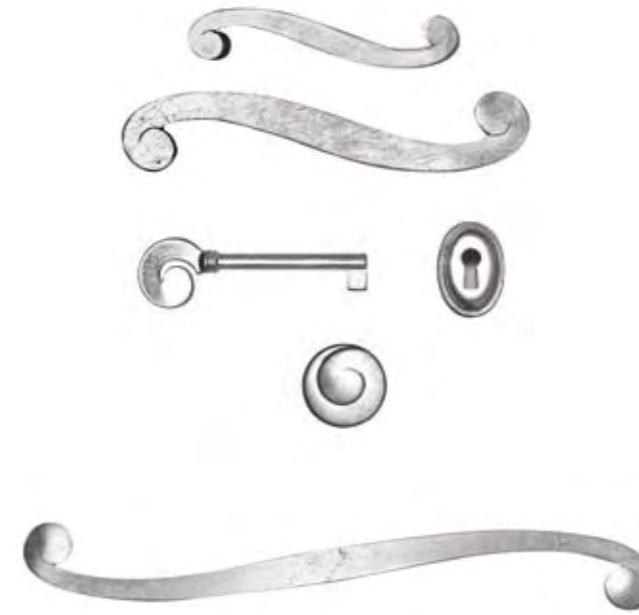
Cod. 6 Maniglie argentate Silver coated handles