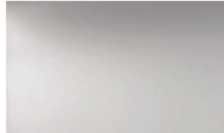
Cod. LA Ecopelle argento lucido Glossy silver eco leather