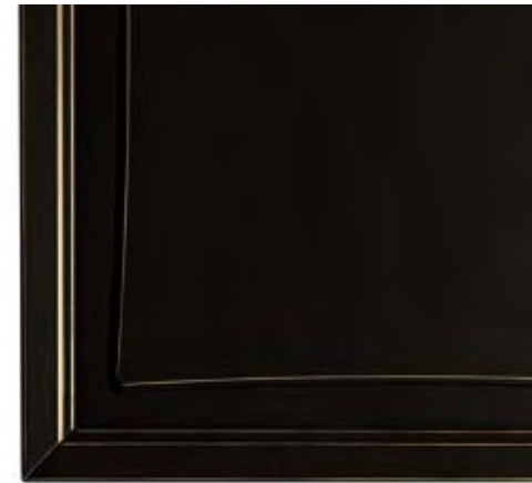
Cod. NE Nero cerato